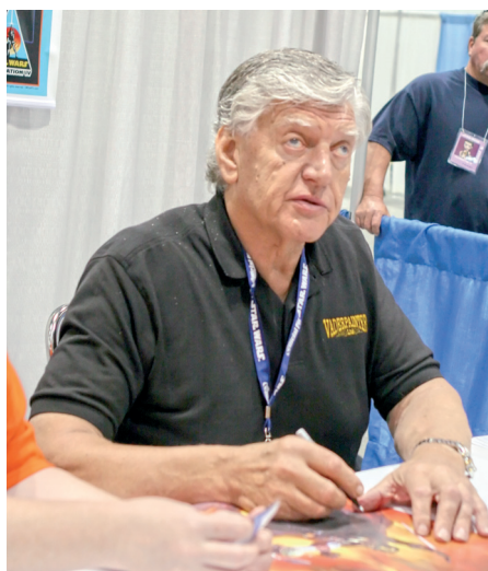
Дэвид Прауз – Дарт Вейдер из ОТ

Интересны не только встречи с актерами, но и с теми, кто работал над Сагой за кадром. Это те, кто совершали прорыв в области спецэффектов, изобретали и творили то, что до них не было сделано ни разу. Эти люди потратили девять месяцев и один миллион долларов на свои изобретения до того, как был снят хоть один кадр, включающий спецэффекты.